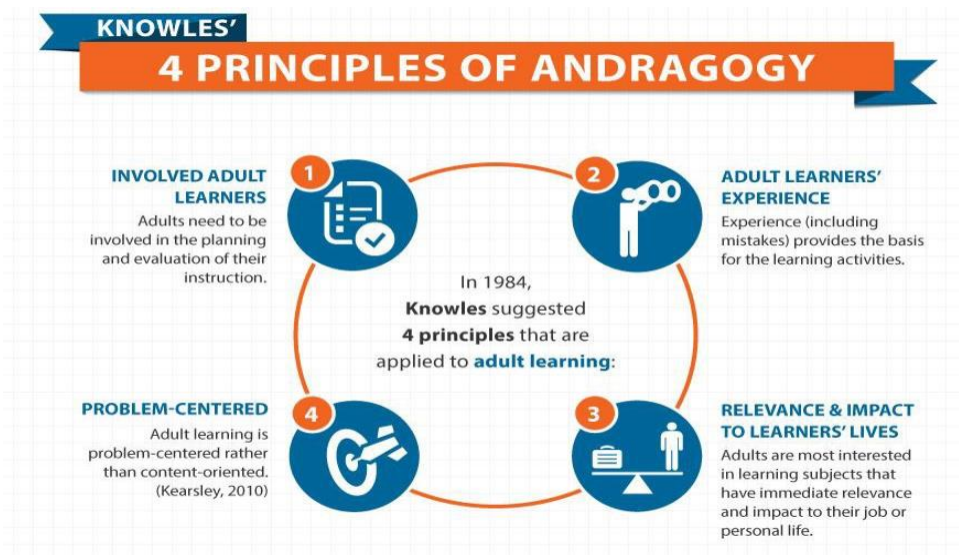
Figura 4. Los principios de la andragogía de Knowles

Otra clave para facilitar el aprendizaje de los adultos incluye ser consciente del deseo de los adultos de saber "por qué" y del deseo de una aplicación inmediata de lo que están aprendiendo. Los adultos tienen objetivos, desde aprobar un examen de equivalencia de la escuela secundaria, hasta acceder a la universidad, formarse y completar con éxito un curso de estudios para obtener un empleo significativo y que mantenga a la familia.