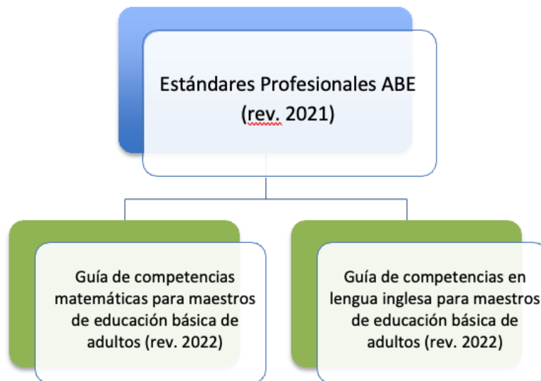
Figura 1. Relación entre los estándares profesionales ABE de MA y las guías de competencias

Los maestros y directores llegan a los programas de educación de adultos desde diversos puntos de entrada, lo que en última instancia enriquece el campo y las experiencias de aprendizaje de sus estudiantes. La Guía de competencias matemáticas sirve para centrar a este conjunto diverso de educadores en una visión común de las matemáticas, especificando lo que los maestros deben saber y ser capaces de hacer en relación con la enseñanza de las matemáticas para adultos.