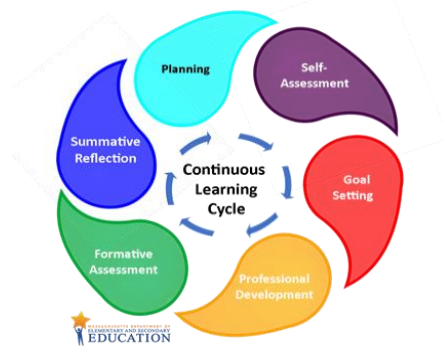
Figura 2. Ciclo de aprendizaje continuo del EGE en seis pasos

El Ciclo EGE comienza con un paso de planificación que invita a los programas a conocer y adaptar el proceso EGE para que funcione eficazmente en el contexto de sus propios programas (Paso 1). Cuando se organiza la logística y un jefe de equipo de EGE se asegura de que se dispone de los apoyos necesarios, el maestro y el asesor empiezan a trabajar juntos. Con la orientación de un asesor experimentado, el maestro consulta los Estándares Profesionales ABE de MA y la guía de competencias pertinente y reflexiona sobre su enseñanza y sus objetivos de aprendizaje profesional (Paso 2). En función de su reflexión, los maestros elaboran un plan de aprendizaje profesional que anclará su desarrollo profesional a lo largo del Ciclo EGE (Paso 3). Con el apoyo del asesor y del jefe del equipo EGE, los maestros buscan oportunidades de aprendizaje profesional, aplican nuevos enfoques y reflexionar sobre los efectos del cambio de su práctica (Paso 4). Se reúnen con el asesor periódicamente para evaluar sus progresos y recibir apoyo y ánimo (Paso 5). Al final del ciclo, el maestro y el asesor revisan las pruebas acumuladas del aprendizaje aplicado, evalúan el progreso hacia los objetivos de aprendizaje profesional y determinan los siguientes pasos (Paso 6).